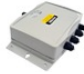
IAC200 4 通道接线盒